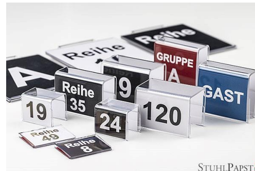
Reihennummerierung zum Aufkleben